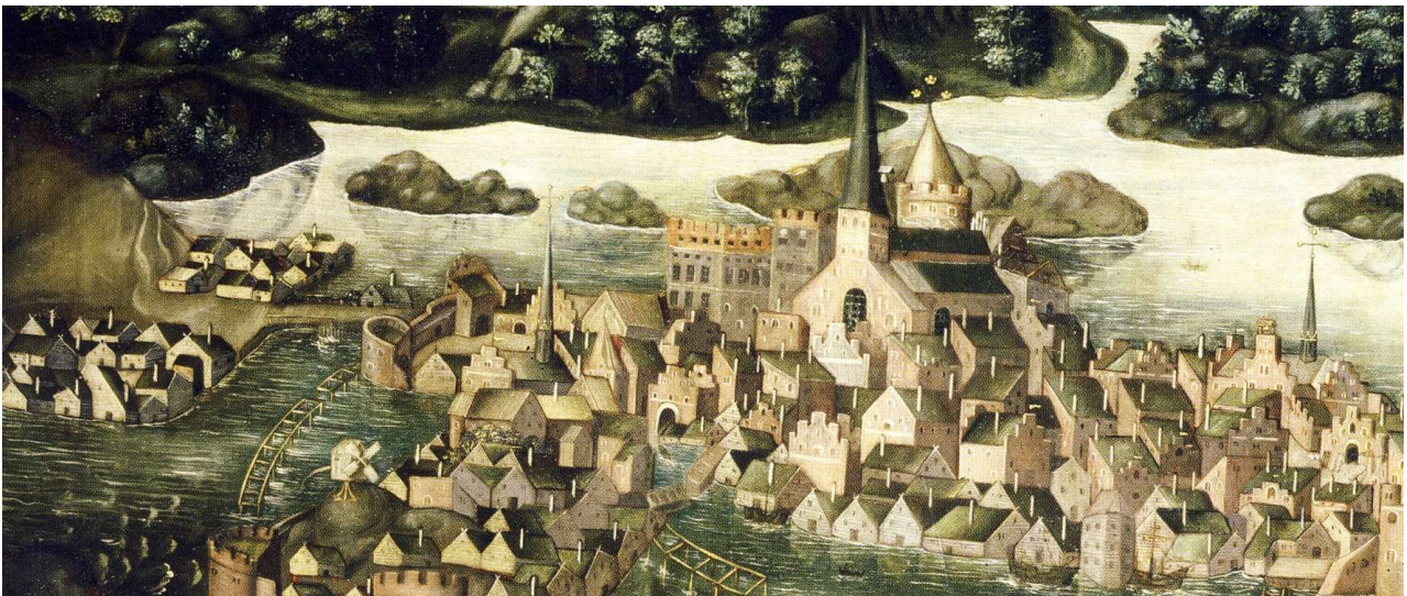
Stockholm 1530-talet. Till vänster i bilden ses Norre port. Till höger om denna, Riddarholmskyrkan. Slottet och Sankt Nikolai kyrka centralt i bilden och längst till höger Sankt Gertrud. (Vädersolstavlan)