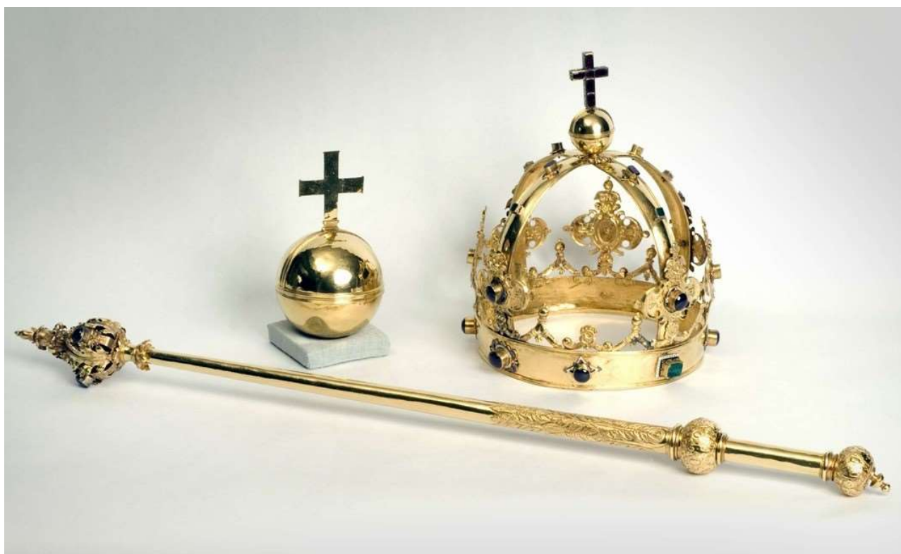
Johan III:s begravningsregalier