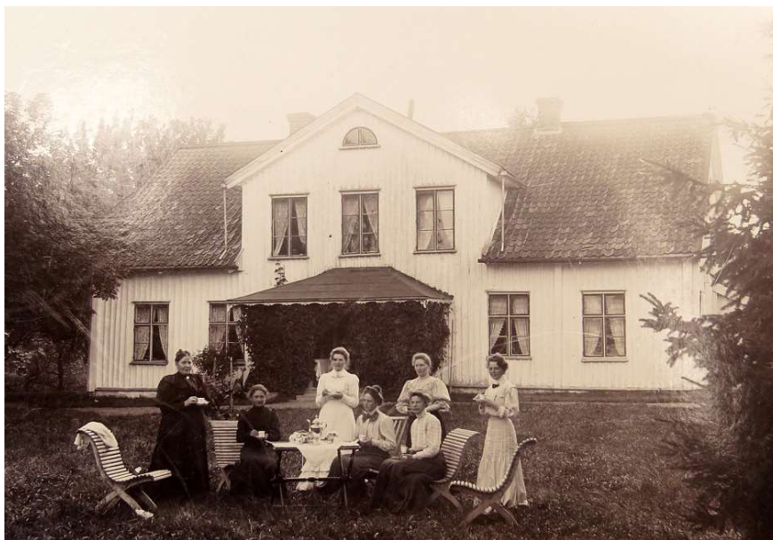
Vänsjö fotograferat i början av 1900-talet. Byggnaden uppfördes cirka 1705 och revs först på 1930-talet

Gottfrid, som avled i Råda 1732 52 . Han är i kyrkböckerna namnlös men uppges vara mellan 60 och 70 år. Kanske hade han följt Gustaf Horst allt sedan kriget i Nordeuropa.