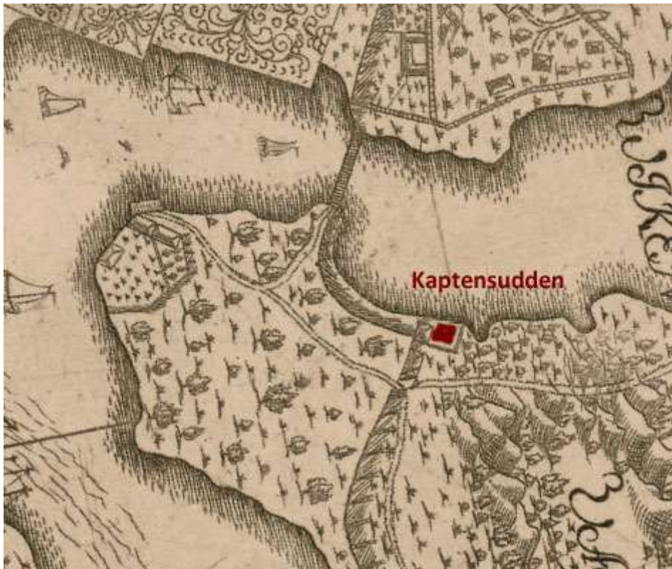
Nordvästra delen av Djurgården. Karta från 1702